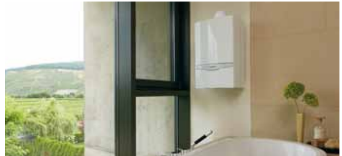
ecoTEC exclusive, une installation compacte et design