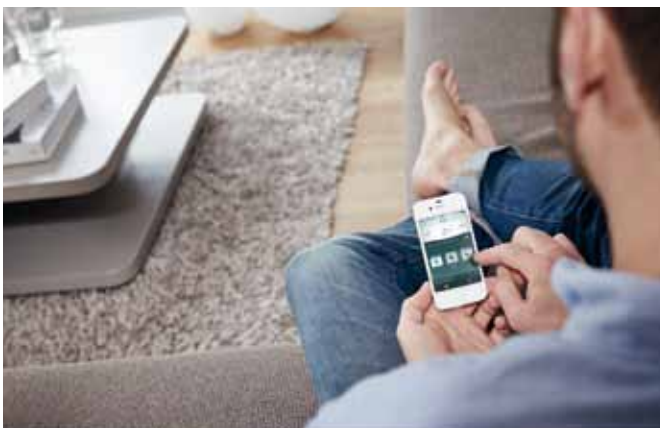
Pilotage de l'ecoTEC exclusive grâce à l'application gratuite multiMATIC